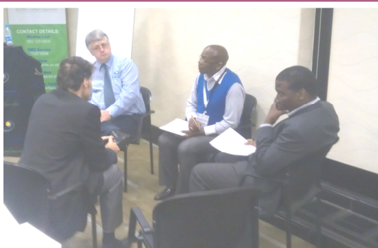
Некоторые из участников семинара по СЭЭ в Йоханнесбурге обсуждают, как инициатива по проекту СЭЭ может быть реализована в южноафриканском регионе