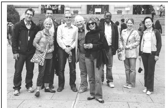
Члены экспертной группы ЭГ/СИПДО ОГПО-МОН/КОС во время совещания в Нанкине, Китай, 28 октября – 1 ноября 2013 г.

На этом совещании был согласован вопрос о разработке онлайн-комплекта инструментов для оказания содействия НМГС, которые хотели бы разработать официальную коммуникационную стратегию для привлечения внешних заинтересованных сторон. Такие стратегии могут быть очень полезны для обеспечения того, чтобы основные сообщения были сформулированы, а целевая аудитория была успешно выявлена. Участники совещания также согласовали вопрос о подготовке краткого руководства для НМГС по использованию Twitter во время погодных явлений со значительными воздействиями и последствиями. Это руководство будет включать в себя советы о том, как использовать Twitter для мгновенного обмена сообщениями в режиме реального времени и для информирования общественности о текущих условиях, взаимодействуя с затронутым сообществом. Заключительный отчет о совещании доступен по следующей ссылке: