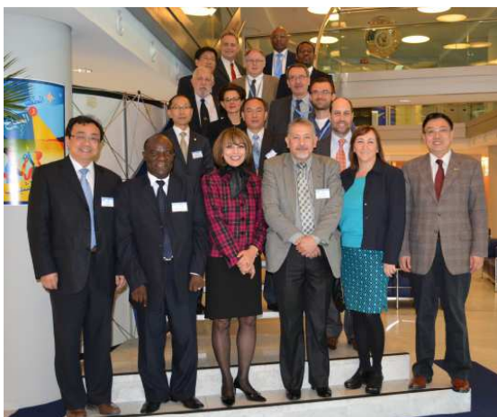
Participants à la réunion du Groupe de travail du Conseil exécutif pour la prestation de services

http://www.wmo.int/pages/prog/amp/pwsp/documents/ECWG-SD-2014_FinalReport_1_.pdf .