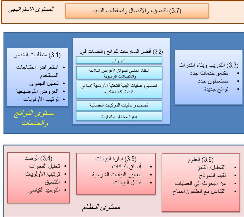
الشكل 1: تقسيم المخططات الوظيفية للأنشطة الرئيسية المقترحة